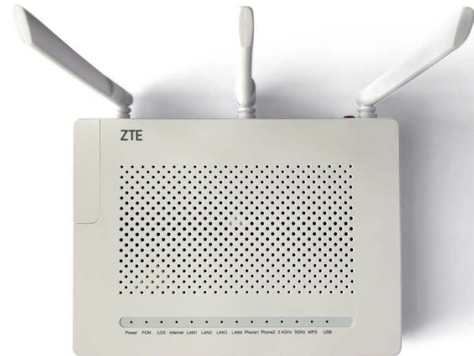
routeur ZTE F670